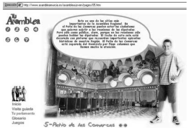
La Asamblea de Murcia dispone de páginas para jóvenes

Por último, y aunque existen vínculos también a ONGs, medios de comunicación, gobierno y ministerios, sindicatos, universidades, etc., queremos destacar la inclusión de direcciones de buscadores en las webs de Andalucía, Cantabria, Castilla y León, y Valencia.