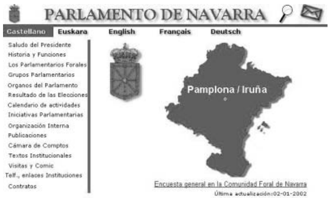
Página de inicio del parlamento navarro con opción de cinco idiomas

de cada comunidad. En trece de los parlamentos visitados se pueden consultar en línea a texto completo. Es posible buscar por número de publicación (boletín oficial o diario de sesiones) en todos los casos y por fecha en la mayoría; sólo en Aragón, Asturias, Cataluña, Navarra y País Vasco funciona la búsqueda por texto en una base de datos. El Parlamento de Galicia vincula a una dirección de correo electrónico para informarse sobre su adquisición.