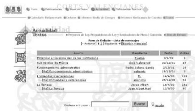
En las cortes valencianas existe un foro para la participación de los ciudadanos

Otra intención que se ha valorado positivamente es la inclusión, en las autonomías que lo contemplan, de las direcciones de las instituciones vinculadas al parlamento en cada caso. Así, el catalán enlaza con la Sindicatura de Cuentas y el Síndic de Greuges (defensor del pueblo); el Vasco, con el Ararteko y el Tribunal Vasco de Cuentas ; el Navarro con la Cámara de Comptos ; el de Castilla y León con el Procurador del Común ; el de Canarias con el Diputado del Común y la Audiencia de Cuentas ; y el de Andalucía con el Defensor del Pueblo y con la Cámara de Cuentas . Resulta pues un aspecto abordado en seis de los ocho casos que pudieran considerarlo.