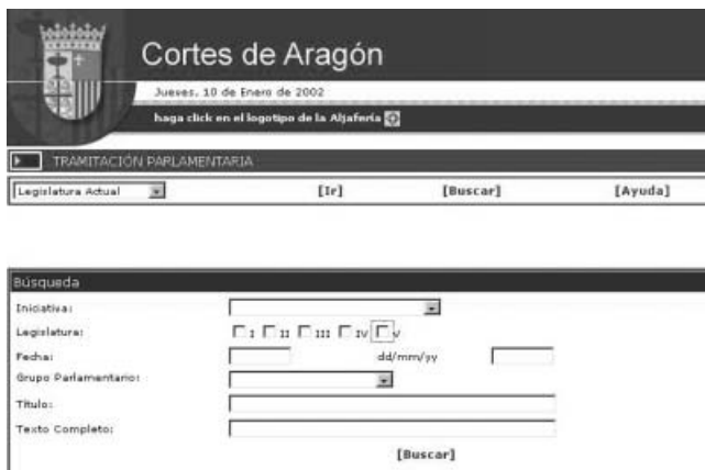
Interfaz de consulta de la base de datos de tramitación parlamentaria de las Cortes de Aragón

6. Enlaces externos a diversas fuentes. Se ha valorado que se sitúen en un apartado propio, circunstancia que ocurre en la mayoría de los casos. No obstante también es cierto que es más costoso enlazar con webs de partidos políticos y con el gobierno de la comunidad autónoma de la que se trate, por lo laberíntico de su localización. Lo ideal sería que todas las páginas vinculadas se recogieran en una sección de enlaces, in-