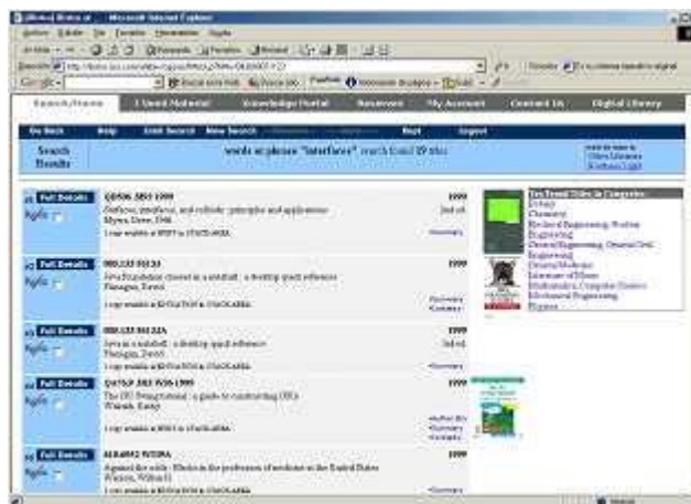
Figura 3. iBistro proporciona la imagen de la cubierta del libro

Seguendo el ejemplo de otros sistemas de información como las librerías en línea, SIRSI ha desarrollado iBistro, un OPAC vía web que está preparado para mostrar junto a cada título recuperado la portada del documento y da acceso al índice, al resumen y a una biografía del autor. En España se ha implantado recientemente (en el 2003) en las bibliotecas de las universidades Carlos III y Rey Juan Carlos, ambas en Madrid, si bien todavía no han aprovechado al máximo las capacidades del sistema. Las figuras 3 y 4 muestran el sistema iBistro en una de las bases de datos de prueba, accesible desde http://www.sirsi.com/Sirsiproducts/elibdemos.html .