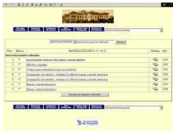
Figura 5. La lista de documentos recuperados en el OPAC de la biblioteca de la Universidad de Zaragoza facilita el título y el año de publicación

los registros recuperados por orden de supuesta relevancia (coincidencia de términos de la consulta con términos de indización de los documentos), como ocurre en el caso del OPAC de la biblioteca de la Universidad de Zaragoza, por continuar con el mismo ejemplo del punto anterior (figura 4). Esta carencia podría solucionarse empleando técnicas de la RI como han hecho los motores de búsqueda de la web, que incorporan, entre otros criterios de ranking, algoritmos de ordenación basados en la frecuencia de aparición de las palabras: a mayor número de palabras coincidentes entre la consulta y el documento, se presupone mayor relevancia.