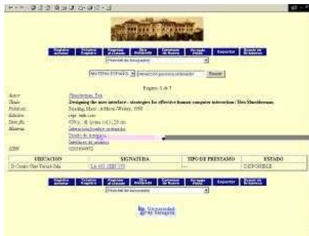
Figura 2. Registro bibliográfico del OPAC de la Universidad de Zaragoza

Seguendo el ejemplo de otros sistemas de información como las librerías en línea, SIRSI ha desarrollado iBistro, un OPAC vía web que está preparado para mostrar junto a cada título recuperado la portada del documento y da acceso al índice, al resumen y a una biografía del autor. En España se ha implantado recientemente (en el 2003) en las bibliotecas de las universidades Carlos III y Rey Juan Carlos, ambas en Madrid, si bien todavía no han aprovechado al máximo las capacidades del sistema. Las figuras 3 y 4 muestran el sistema iBistro en una de las bases de datos de prueba, accesible desde http://www.sirsi.com/Sirsiproducts/elibdemos.html .