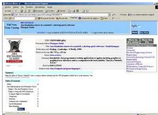
Figura 4. iBistro puede contener el resumen y el índice de los documentos

Otra dificultad más para que el usuario valore los resultados reside en que los OPACs habitualmente no ordenan